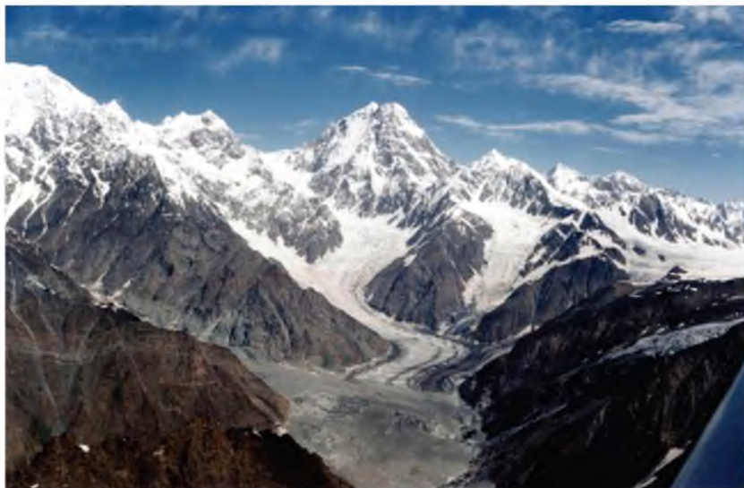
Пирыххо – тавлидгари оби мусаффо