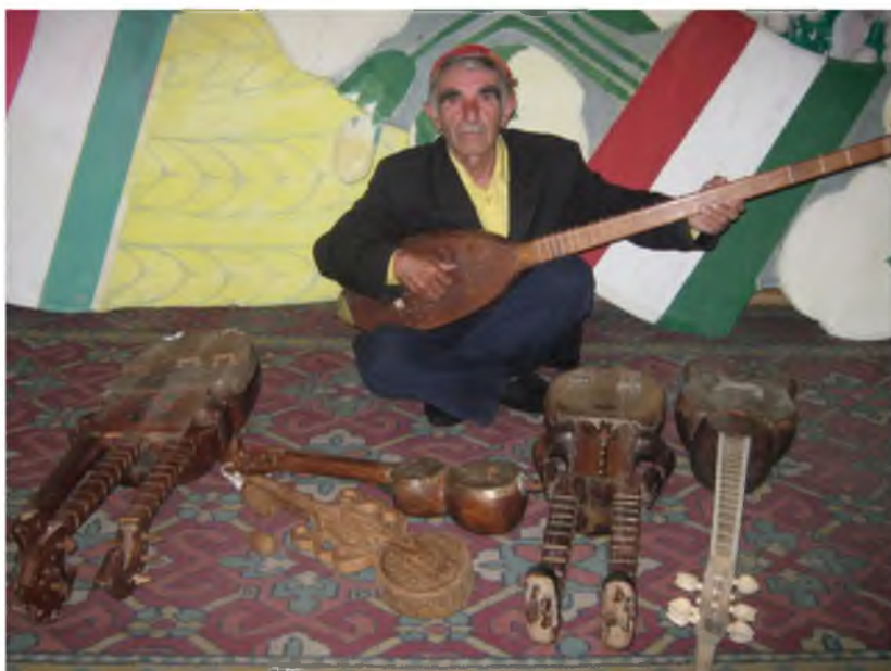
Такмили созҳои халқӣ