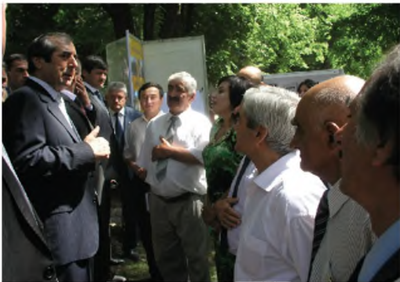
Рӯзҳои фарҳанги Бадахшон дар ш.Душанбе (2011)