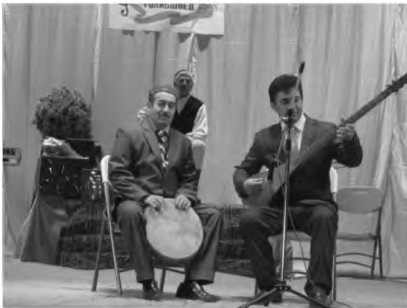
Хунармандони ноҳияи Роштқалъа дар фестивали «Андалеб»

Дар солҳои аввали истиқлолият 1992-1995 тамоми чорабиниҳои фарҳангии фароғатие, ки дар ҷумҳурии бахшида ба ҷашнвораҳои таърихию сиёсӣ ва илмӣ-фарҳангии гузаронида мешуданд, дар ВМКБ низ таҷлил мегардиданд. Аз ҷумла, бахшида ба 1000-солагии «Шоҳнома»-и Ҳаким Фирдавси озмуни анъанавии сурудҳои тӯёна дар се давр гузаронида шуда, дар он гуруҳҳои хунарии ноҳияи Роштқалъа, Шугнон ва шаҳри Хоруг сазовори се ҷои аввал гардиданд.