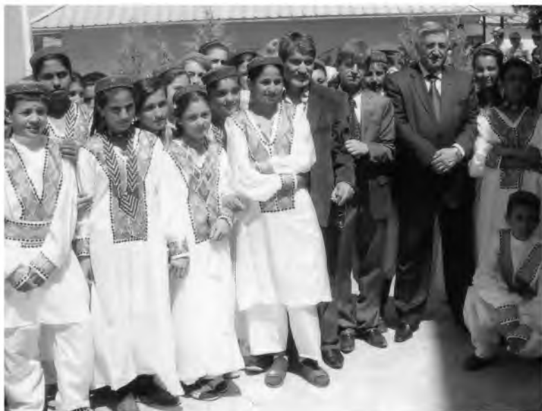
Вазири фарҳанги Ҷумҳурии Тоҷикистон Мирзошоҳрух Асрорӣ дар байни хунармандон