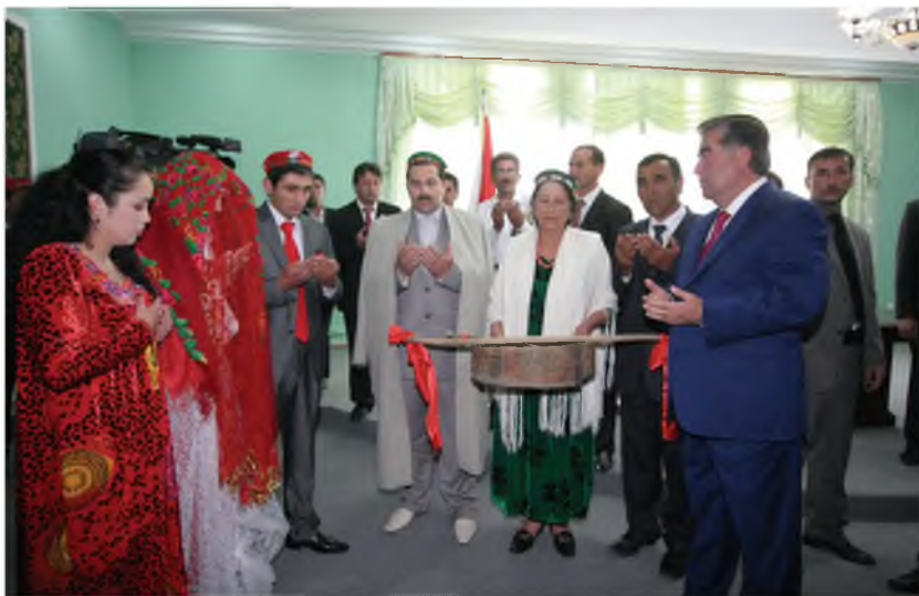
Дуои хайр бар навхонадорон (2010)