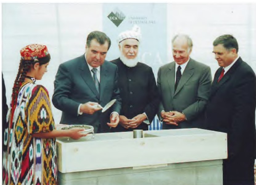
Гузоштани хишти аввал дар бинои Донишгоҳи Осиёи Марказӣ