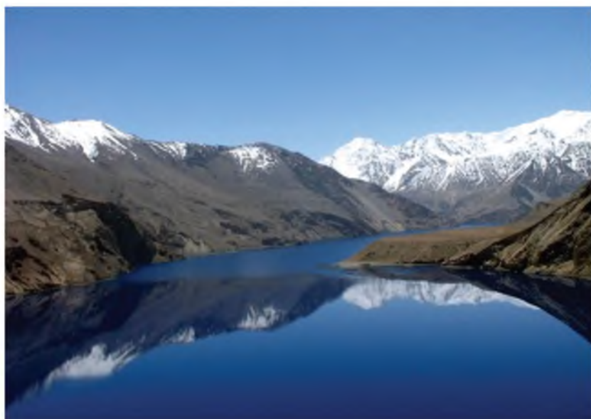
Сарез – калонтарин захираи оби нӯшокӣ дар минтака