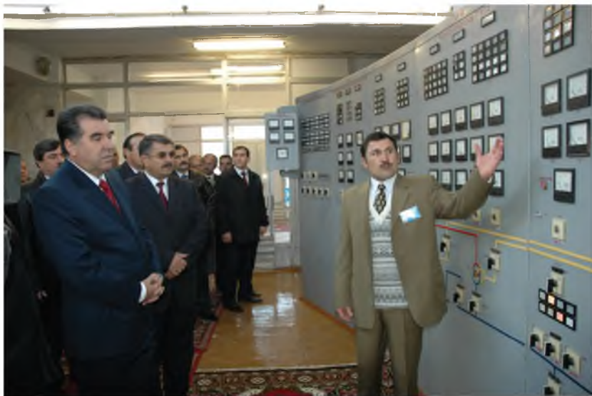
Толори идоракунии техникий НОБ-и ш.Хоруғ