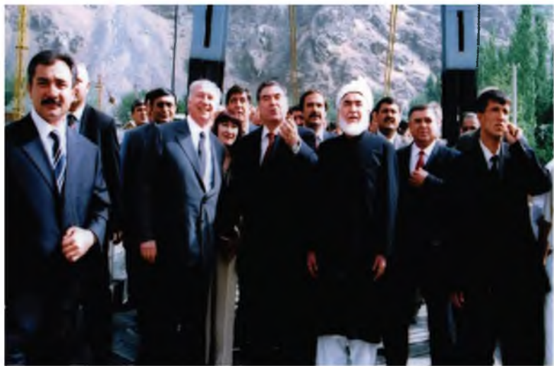
Чудо будем мо даҳсолаҳо, охир бипайваستم