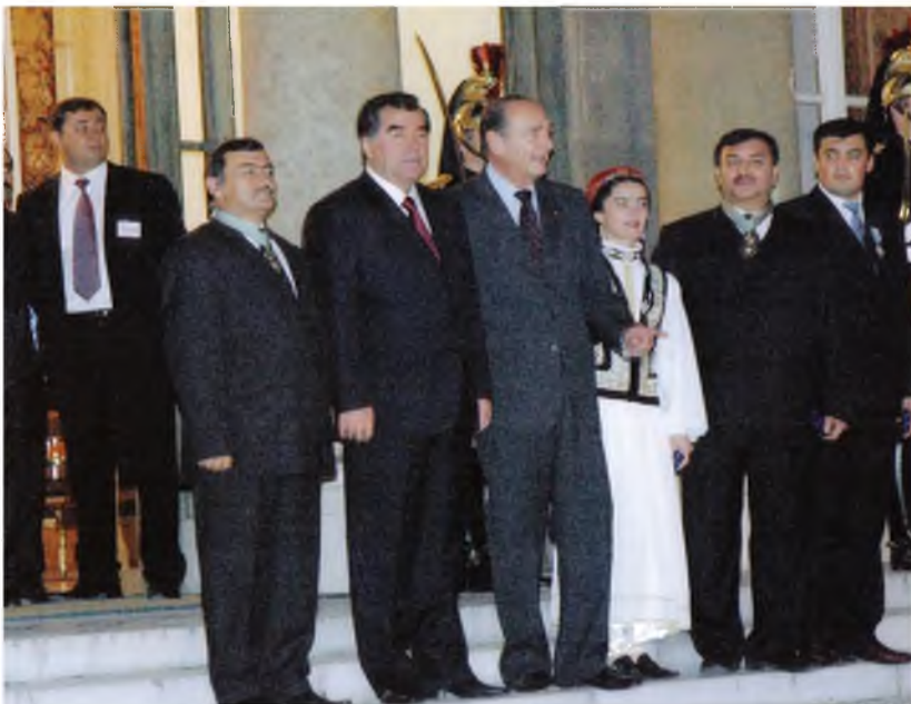
Президенти Тоҷикистон Эмомалӣ Раҳмон ва Президенти Фаронса Жак Ширак бо иштирокчиёни Рӯзҳои фарҳангии Тоҷикистон дар ЮНЕСКО (Д.Холов, С.Давлатшоева, А.Абдурашидов, А.Ҳаловатов, соли 2005)