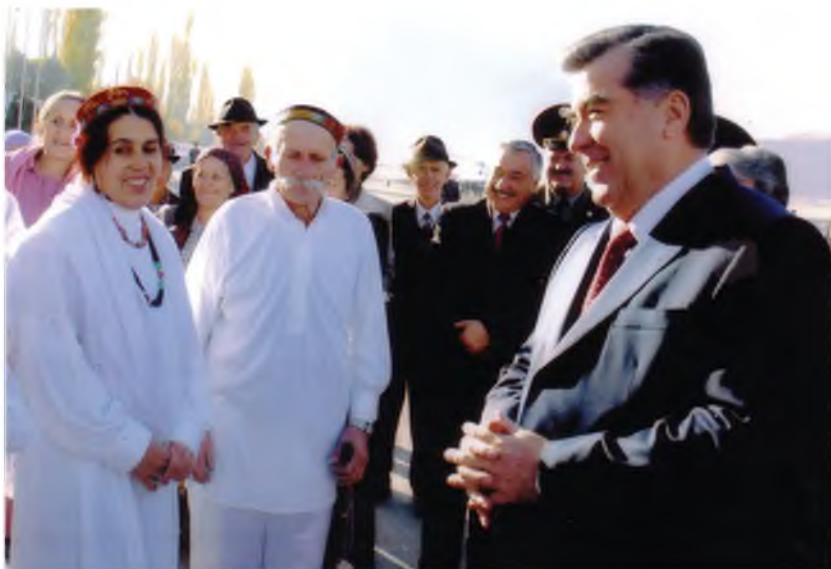
Воҳӯрии Сарвари давлат бо собиқадорони санъат (2010)