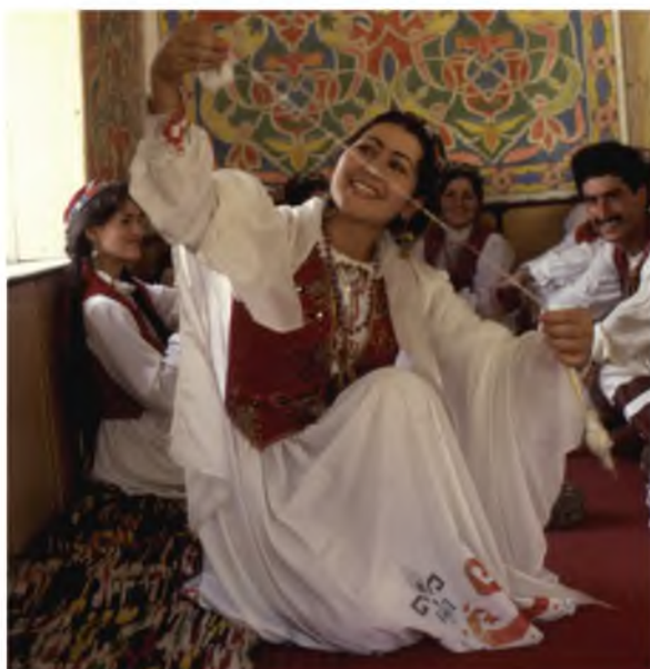
Риштаи дастам бубин – чун роҳи икболи ман аст