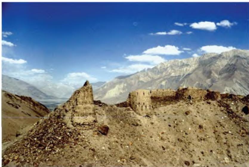
Ёдгорс аз асри кухан