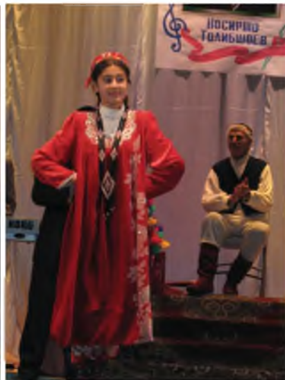
Санъати ман – рамзи меҳри Меҳан аст