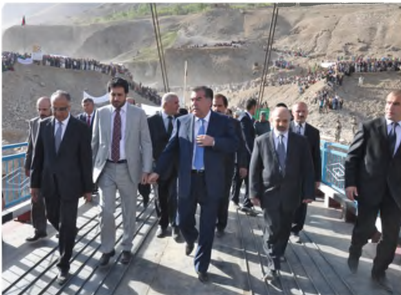
Пули панҷуми миёни Тоҷикистону Афғонистон дар мавзеи Хумроғии ноҳияи Ванҷ мавриди баҳрабардорӣ қарор гирифт (2011)