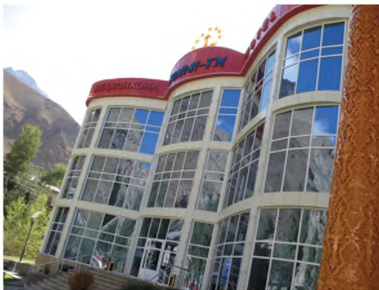
Мархабо, ба меҳмонхонаи «Гармчашма»!