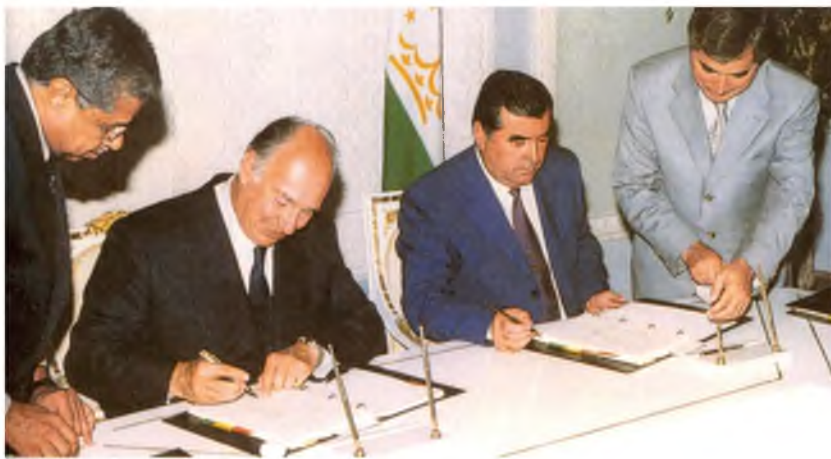
Президенти Ҷумҳурии Тоҷикистон Эмомалӣ Раҳмон ва Пешвои исмоилиёни ҷаҳон Шох Карим ал-Ҳусайнӣ хангоми имзои Шартнома дар бораи таъсиси Донишгоҳи Осиёи Марказӣ (Душанбе, 2000)