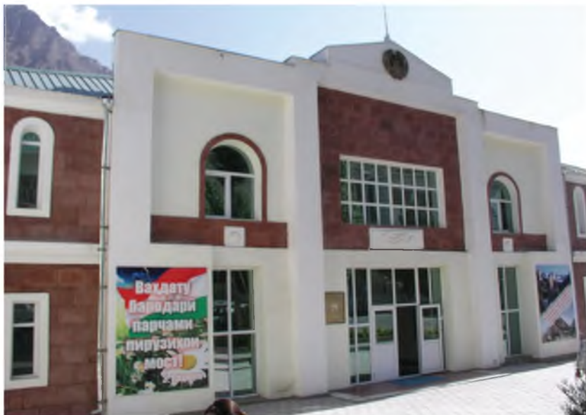
Кумитаи радио ва телевизиони ВМКБ