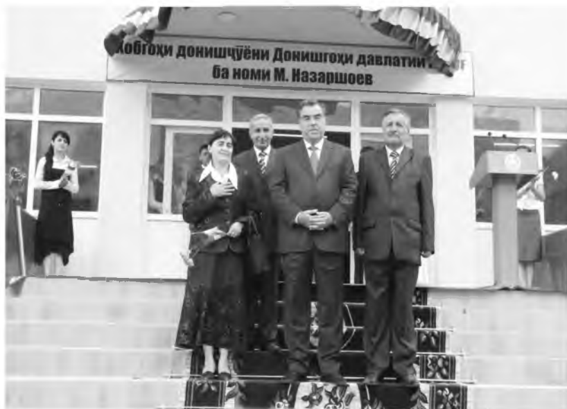
Миннатпазири маъмурияти донишгоҳ аз ташаббусу кӯмаки Президент дар сохтмони хобгоҳи ба талаби замон ҷавобгӯ.