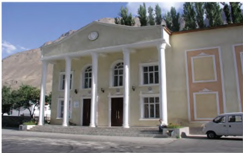
Театри вилоятии ба номи М.Назарови ш.Хоруг