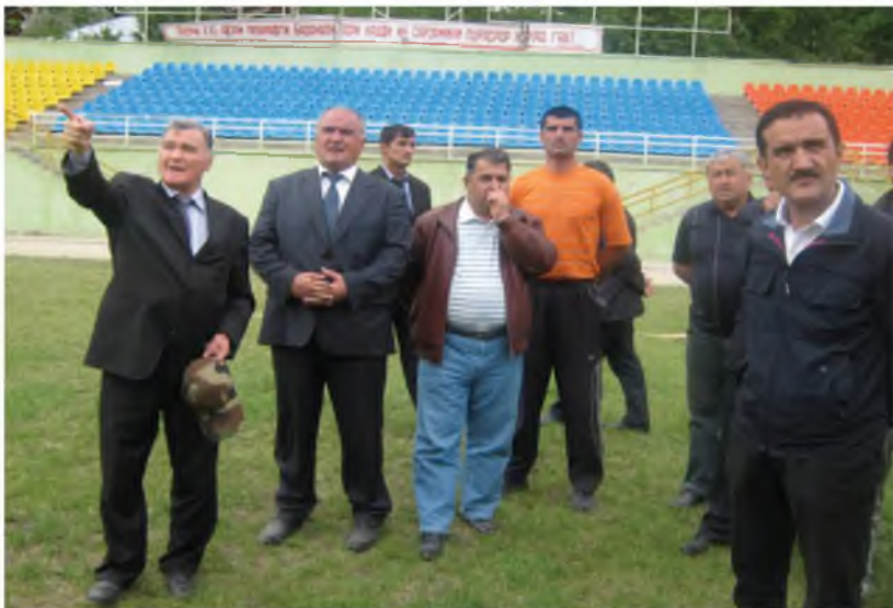
Сарвазири ҷумҳури Окил Окилов бо Раиси ВМКБ Қодирӣ Қосим дар майдони варзиш (2010)