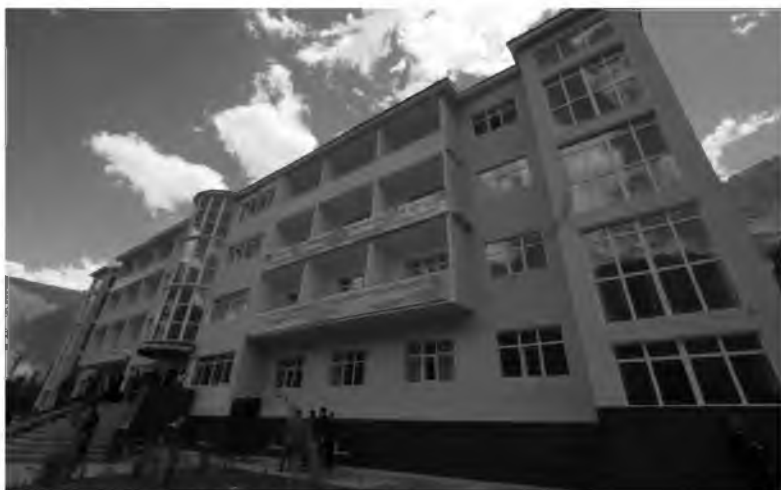
Намуди беруни хобгоҳ