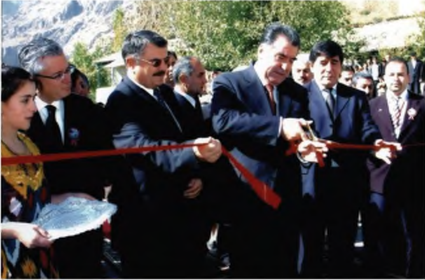
Президенти Ҷумҳурии Тоҷикистон Эмомалӣ Раҳмон хангоми кушодани қитъаи Шкев-Зиғар ва Шохон-Зиғари шохроҳи автомобилгарди Кӯлоб-Қалъаихумб (2005)