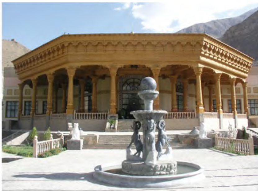
Чойхона – ҷои сӯхбатҳои гарм