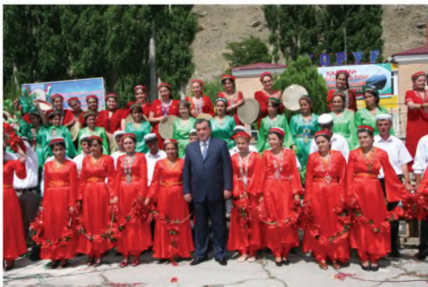
Донишҷӯён идомадихандаи ободкориҳои кишваранд