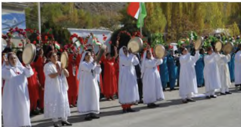
Истикболи меҳмонон дар фурудгоҳ