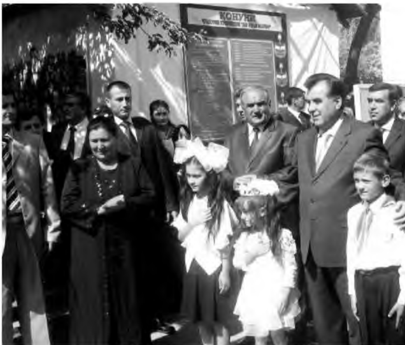
Сарвари давлат Эмомалӣ Раҳмон ва раиси вилоят Қосими Қосим дар интернати бепарасторони ноҳияи Рӯшон. (Моҳи июни соли 2010)

Харочоти соҳаи маориф аз ҳисоби бучети вилоят сол то сол афзоиш меёфт. Соли 1990 он 45 фоизи ҳаҷми умумии бучети вилоятро ташкил мекард, соли 2004 ин нишондиҳанда ба 59 фоиз расид. Ин дар сурате мегузашт, ки ҳуди бучети вилоят ҳамасола афзоиш дошт. Аз соли 2000 ҳаҷми маблағгузори соҳаи маорифи вилоят ҳамасола ба маротиб зиёд карда мешуд. Соли 2004 аз тарафи Вазорати маорифи Тоҷикистон ба мактабҳои вилоят бо теъдоди зиёда аз 65 ҳазор китобҳои дарсӣ ҷудо карда шуд. Ин ба азхудкунии талабагон бетаъсир намонд. Натиҷаи он дар соли таҳсили 2003 – 2004 бо баҳои аъло ҷамъбаст намудани зиёда аз се ҳазор хонанда зоҳир гаштааст.