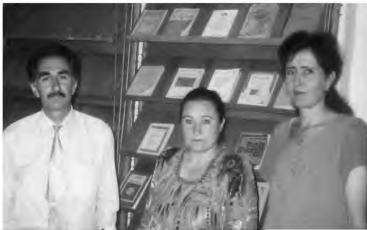
Сарвари китобхонаи вилоятӣ бо ҳамқорон