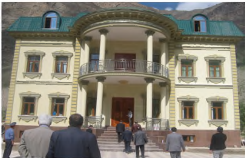
Боз кард дарҳои худро бар чавонон кохи нав