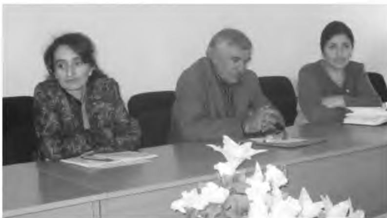
Қормандони Раёсати ҷавонон, варзиш ва сайёҳии ВМКБ

Мавриди қайд аст, ки Пойгоҳи (базаи) гузаронидани машғулиятҳои мактабҳои варзиши вилоят ба ғайр аз шаҳри Хоруг дар дигар ноҳияҳои вилоят дар ҳолати ноустуворӣ қарор гирифтааст. Аз соли 1997 сар қарда, мактабҳои варзишии бачагонаи вилоят ба ихтиёри собиқ Кумитаи варзиши вилоят воғузур қарда шуданд, ки ин дар навбати худ ба коста шудани қори умумии мактабҳои варзишии шаҳр ва ноҳияҳои вилоят оварда расонд. Сабаби асосӣ дар он аст, ки тамоми иншоотҳо ва толорҳои варзиши дар ихтиёри шӯъбаҳои маориф қарор доранд. Хуб мешуд, ки бо дастгирӣ ҳукумати маҳаллӣ барои дастаҳои яккачини вилоят шароити мусоид муҳайё қарда мешуд. Ин бешубҳа барои дар мусобақаҳои ҷумҳуриявӣ ва байналмиллалӣ бомуваффақият баромад қардани дастҳои яккачини шаҳру ноҳияҳои вилоят бештар имкон фароҳам хоҳад овард. Соли 2010 то 1 ноябр варзишгарони вилоят дар 18 мусобақаҳои ҷумҳури ва 4 мусобақаҳои байналмилалӣ ширкат варзидаанд.