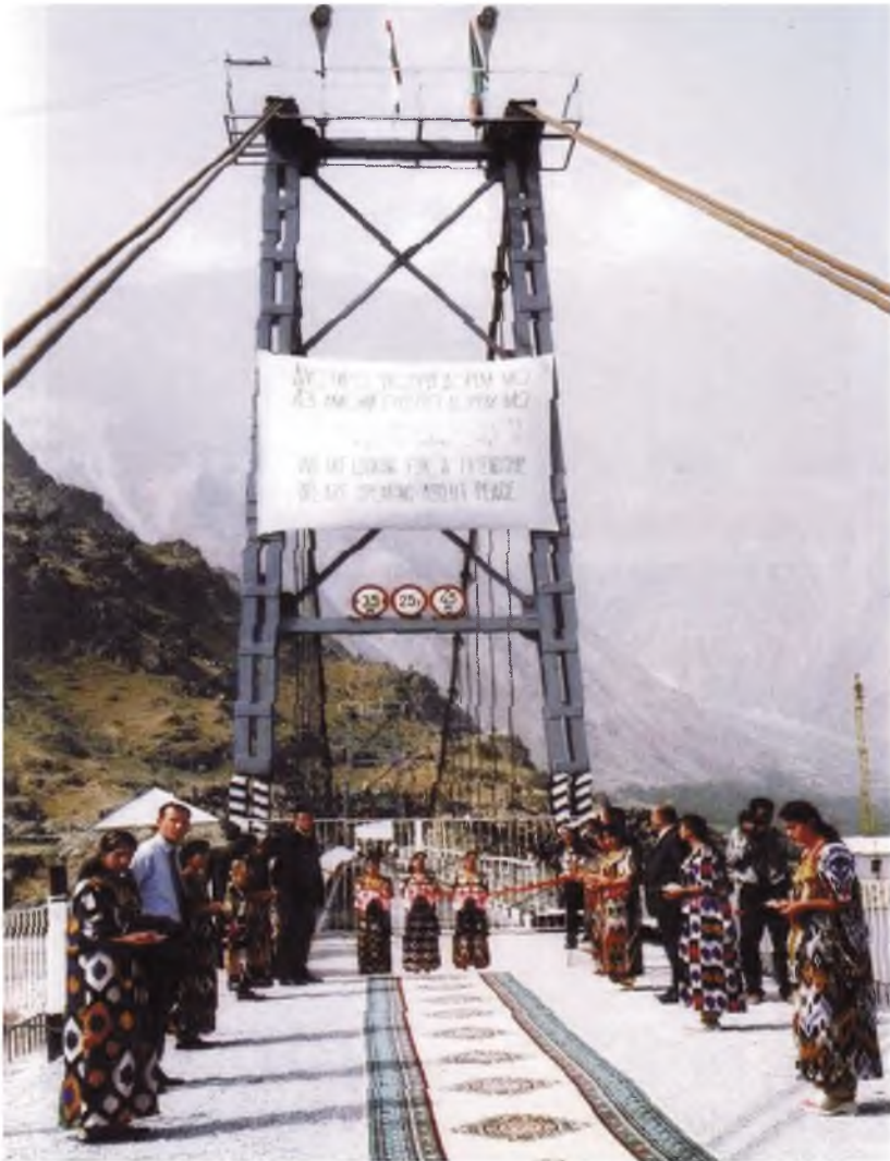
Пули пайвандгари ду соҳили дарёи Панҷ дар деҳаи Рузвайи ноҳияи Дарвоз, 2004