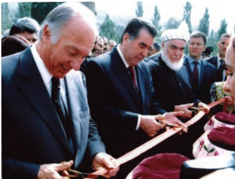
Сарвари давлат Эмомалӣ Раҳмон ва Оғохони IV хангоми қушодани пули Рузвай (Дарвоз) миёни Тоҷикистону Афғонистон. (2004)