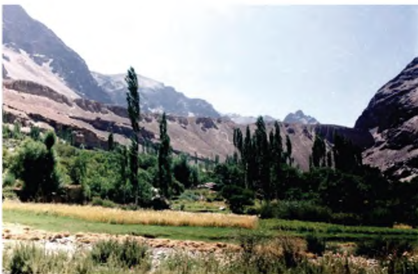
Манзараи дехоти кӯхистон