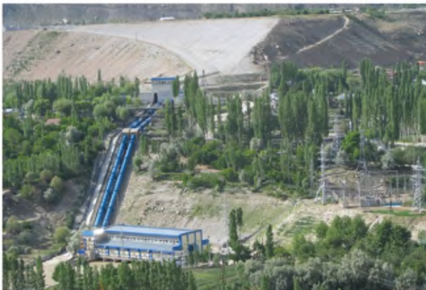
Намуди умумии НОБ-и ш.Хоруғ