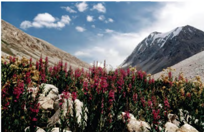
Табиати бихиштосои Бадахшон