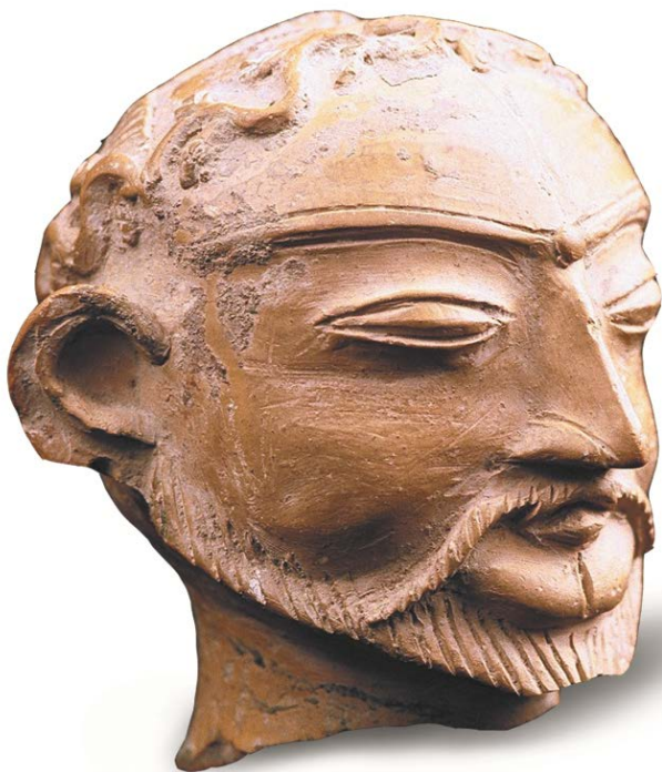
Голова мужчины. Глина обожжённая. Закоттепа (Регар). IV-V вв. н.э.