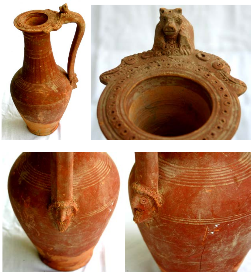
Кувшин. Бустан. I-II вв. до н.э.