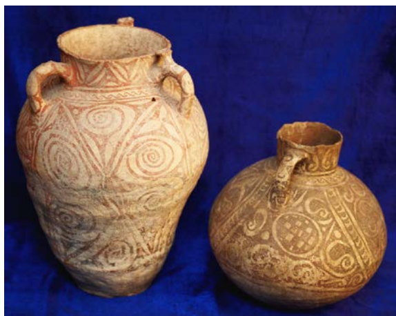
Кувшин лепной. Орнамент – лепной краской. Поселение Шишихона. IX – XII вв. н. э.