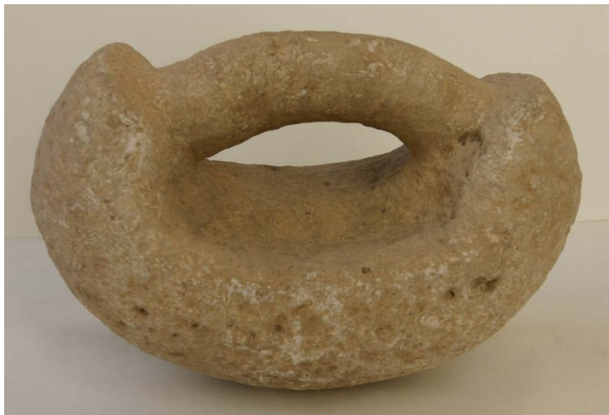
Каменная гиря. Могильник Тандырйул. Последняя четверть II тыс. до н.э.