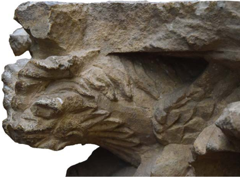
Капитель. Шахринав. II-I вв. до н. э.