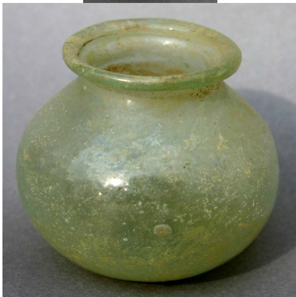
Стеклянные изделия для парфюмерии. Калаи Кафарниган. IV-VI вв. н.э.