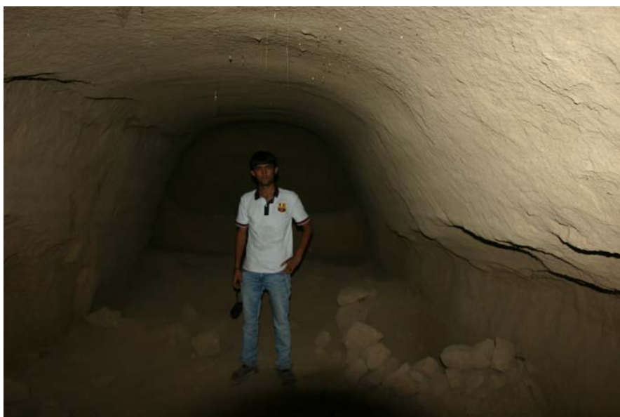
Буддийские пещерные храмы. Бустан. (Чангалак).