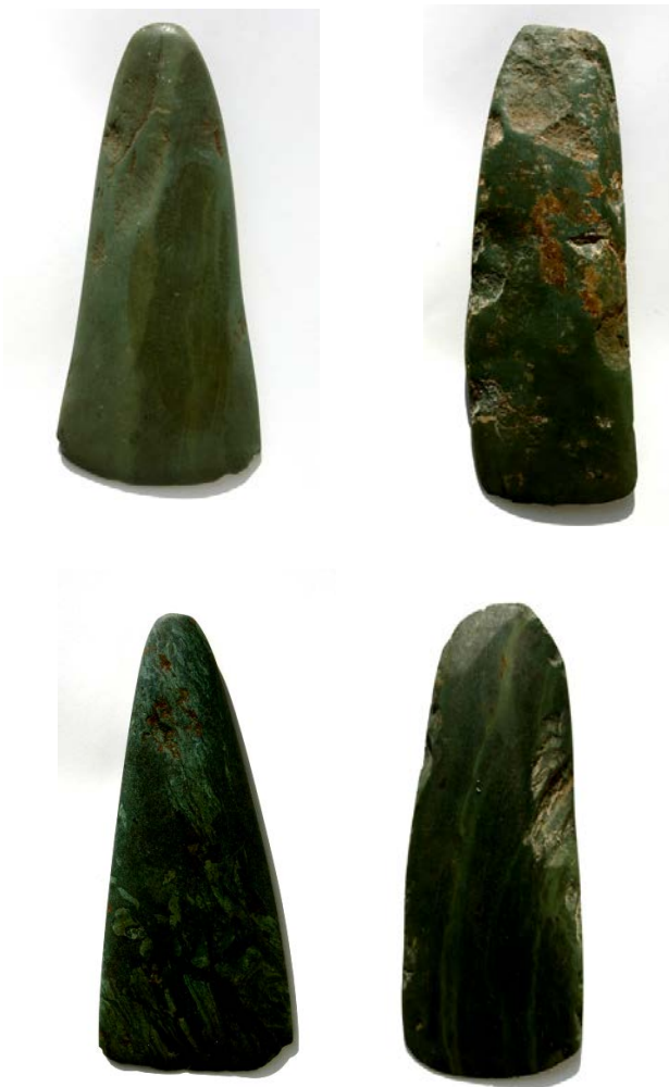
Каменный топоры. Стоянка Лучоб. Неолит (6-4 тыс. до н.э.)