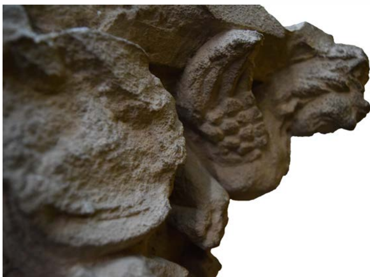
Капитель. Шахринав. II-I вв. до н. э.