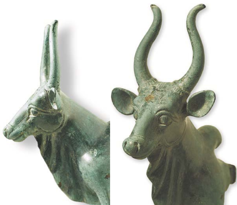
Скульптура зебу. Деталь трона. Бронза. Симиганч. V-III вв. до н.э.