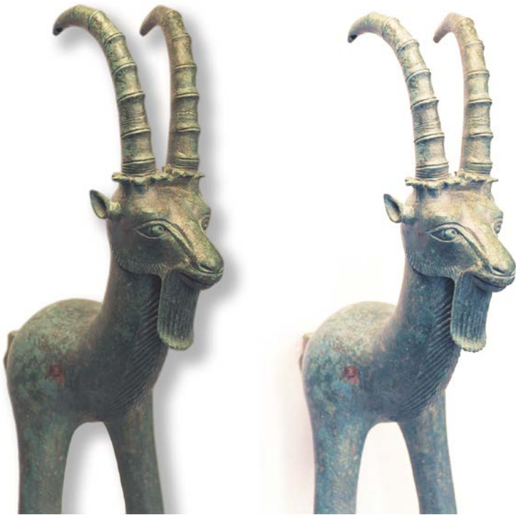
Скульптура горного козла (козерог). Бронза. Симиганч. V-III вв. до н.э.