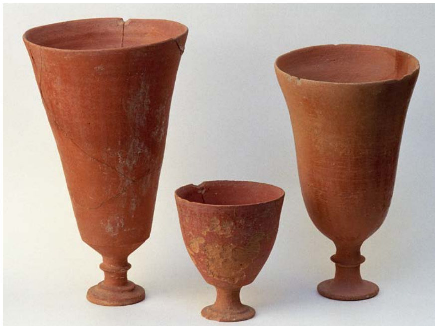
Бокалы. Глина обожженная. Могильник Тупхона (Гиссар). I-III вв. н.э.