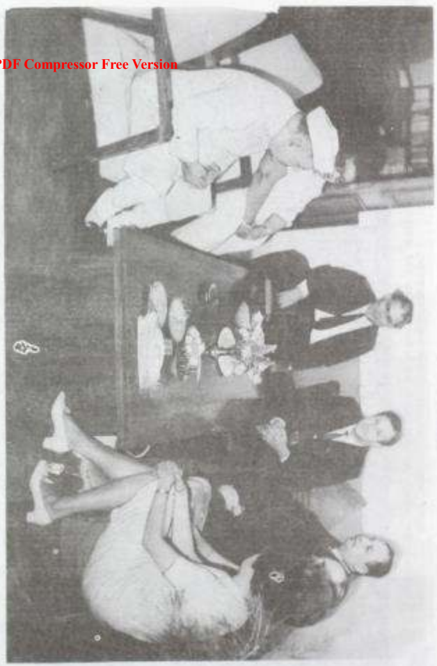
Додоюн Фахруов дар халқин донишжандони Донкишотга мусулмонин Омехарх.