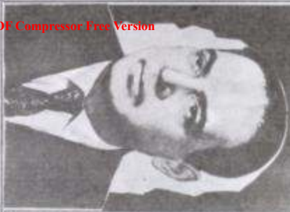
Ақсау кырықтан Ахпаз Мұхтардан 60 нөмір «Ақарыстан» Бодуғын Фарыпов»