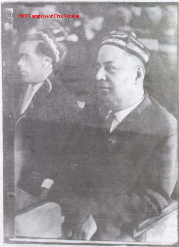
Бобонон Фафуров дар ҷаласаи Шӯрои Олимп СССР, соли 1968.