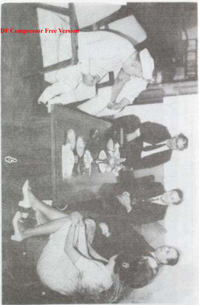
Бобоқов Фарғон дэр кэдкэн дэушмэнкөн Дэушкөн мураскөн Олларк.