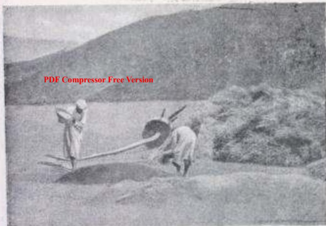
Проведение шевницы (1898)

сбор за толчей), мирабона (подать в пользу наблюдателя за правильным расходом воды) и др.