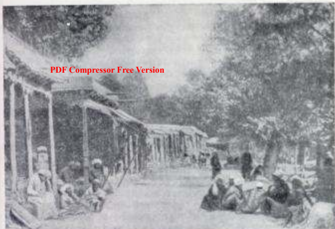
Базар в Каратаге

тельные бесплатные наряды на ту или иную работу, например, на постройку дворцов, мечетей, дорог, мостов, на проведение и очистку оросительных каналов, устройство колодцев и т. п.