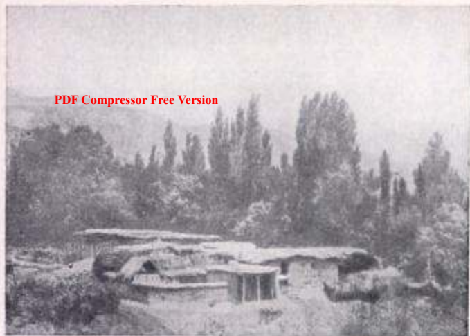
Кишлак в Дарвазе

ды, имамы и муллы. Духовенство представляло очень сплоченную корпорацию, спаянную ортодоксальным духом мусульманства, покоящегося на непреложных велениях шариата 102 . При этом «никакая свежая мысль, никакое новшество или даже намек на него не могли проникнуть в эту окаменелую в своей неподвижности среду» 103 . В Бухаре влияние мусульманского духовенства на все социальные группы было очень сильно. Даже эмир мог осуществлять то или иное дело, лишь получив «совет» представителей духовенства; последние пользовались огромным влиянием внутри страны и за ее пределами. Поэтому эмиры старались не вступать в конфликт с этой корпорацией. И часто наблюдались случаи, когда эмиры вынуждены были отступить от своих решений, если духовенство их не одобряло. Духовенство всегда находило себе поддержку среди огромной корпорации студентов мадраса — мулло-бачей. Последние тоже имели свои группы (в основном две). К первой относились дети чиновников из Бухары и ее окрестностей, ко второй — приезжие (главным образом из Восточной Бухары). Правящие круги эмирата в своих корыстных целях старались держать связь с мулло-бачами, поддержка которых гарантировала им занимаемую должность. Обычно крупные чиновники стремились привлечь на свою сторону мударрисов, поскольку последние,