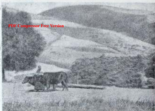
Молотьба «чапором» (1898)

колонией в Туркестане начали возникать частные коммерческие банки, которые также закабалили местное население.