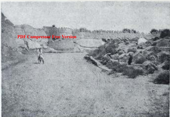
Городская стена в Бухаре

бождения русских пленных 71 . Однако эмир принял миссию недружелюбно и заставил ее покинуть пределы ханства. По возвращении в Россию участники миссии составили интересный материал для изучения истории Бухарского ханства.