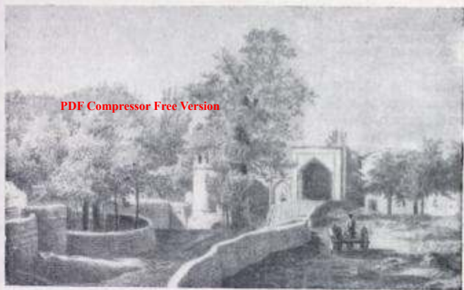
Мадраса в Ходженте

ми представителями, которым предоставляли большие льготы по части оптовой торговли и порою даже освобождали от второстепенных поборов. Зато притесняли средних и мелких торговцев. Последние нередко скрывали количество своего товара от алчных глаз хана и его должностных лиц. В ханстве «опасно было прослыть богатым, иметь напоказ много товара, почему торговцы выставляли в своих лавках на вид не больше как недельную порцию товаров, а излишек прятали в домах» 139 .