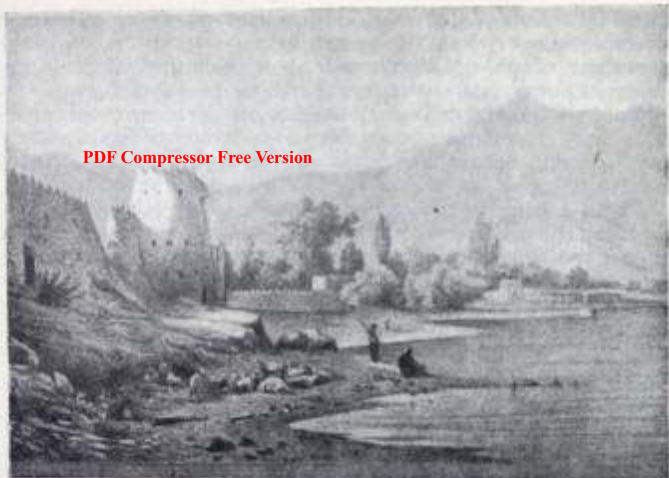
Часть городской стены в Ходженте

пишут историки эмира Хайдара, Алим-хан кокандский в одном из своих походов на Ура-Тюбе приказал собрать тела убитых в бою людей и перенести их под городские стены. Трупы были сложены в виде лестницы, а солдаты Алим-хана, поднимаясь на них, вели бой с осажденными горожанами 27 .