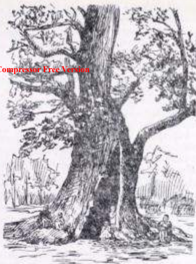
Школа в дупле дерева (кишлак Йол, XIX в.)

ственных наук, математики и истории учащиеся мадраса получали ничтожные знания.