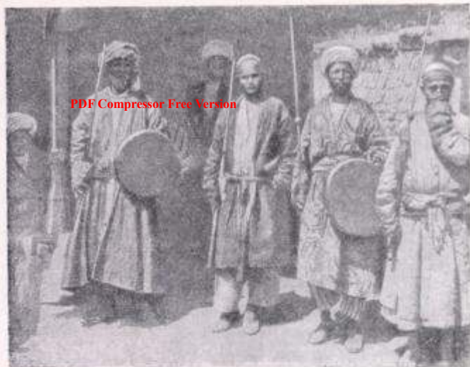
Ночная стража Каратага (1898)

должны были на это обеспечить себя и свою семью питанием и жильем) нередко толкало их на мародерство. Солдаты (особенно из эмирской свиты) позволяли себе всяческие бесчинства, вызывая ненависть населения к себе и своим командирам 105 .