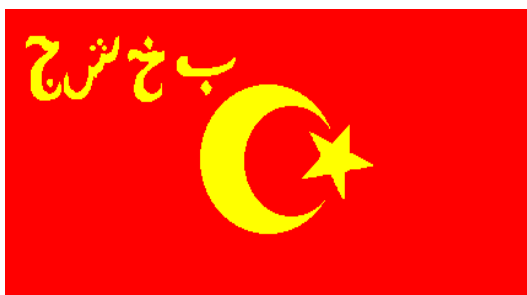
Парчами Республикаи Халкии Шӯравии Бухоро, солҳои 1923-1924