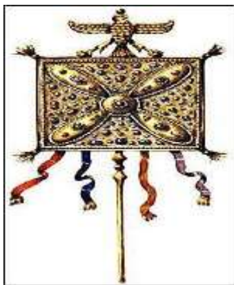
Парчами Империяи Сосониён Дирафши Ковиён. Дар Осорхонаи миллии Эрон