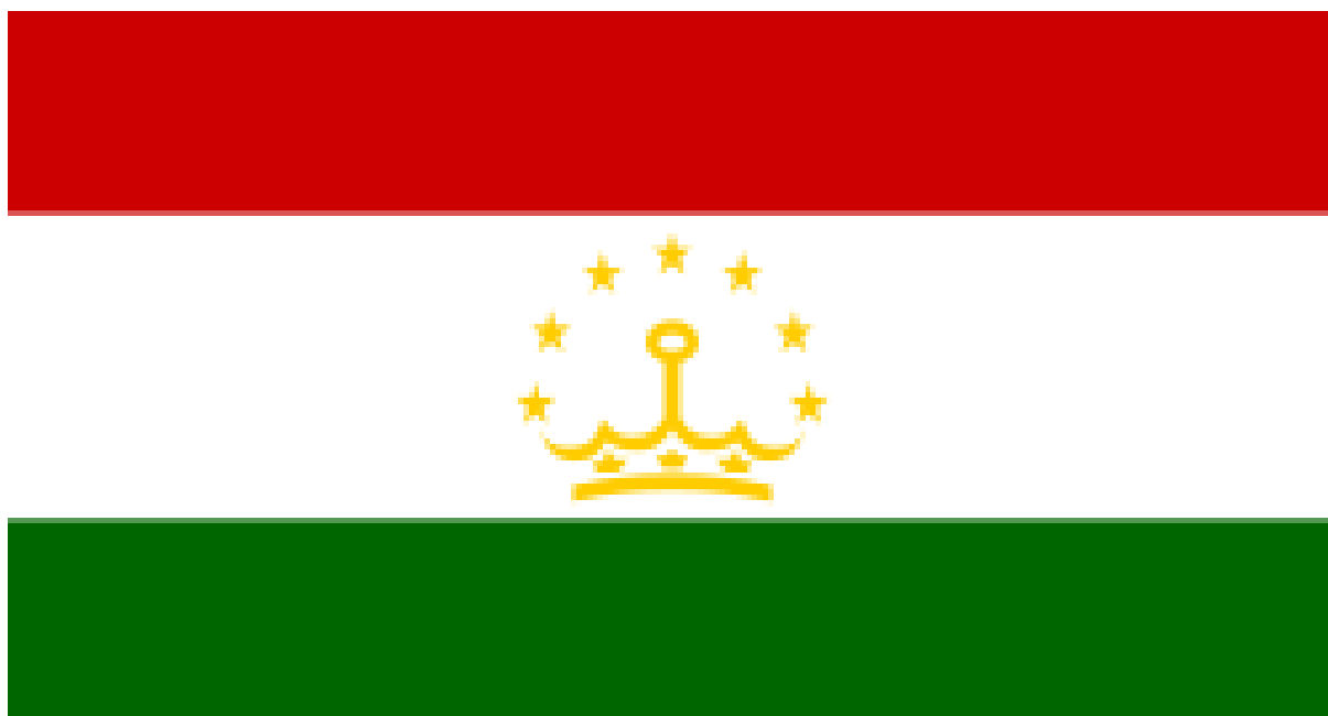
Парчами давлатии Ҷумҳурии Тоҷикистон