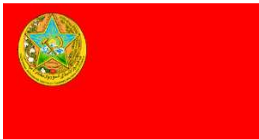
Парчами РСС Тоҷикистон, 1929 -1953