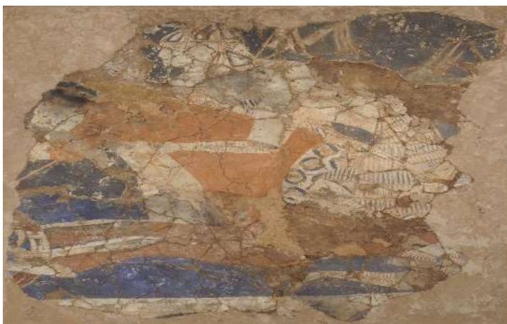
Деворнигора. Бунчекат (Шахристон). асрҳои IX - XII