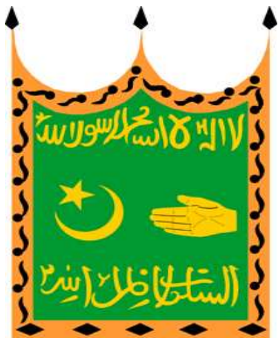
Парчами Аморати Бухоро