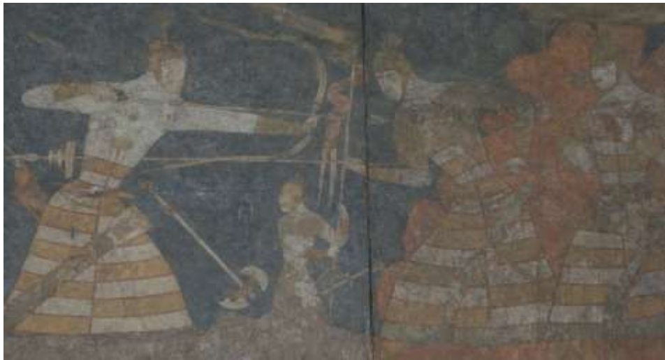
Деворнигора. Панчекати Қадим асрҳои V-VIII