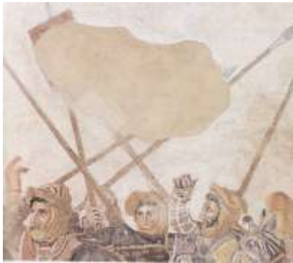
Парчами Дорой III