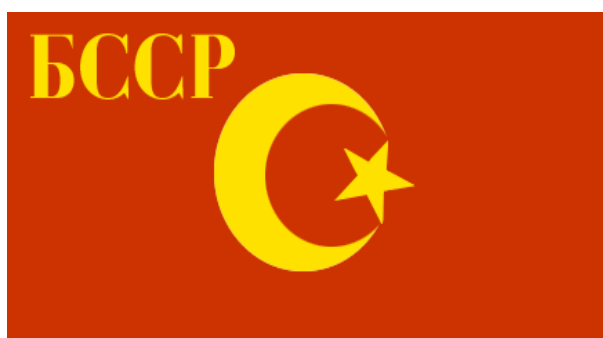
Парчами Республикаи Советии Сотсиалистии Бухоро, соли 1924