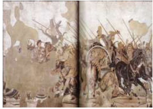
Муборизаи Искандар бо Дорой III (деворнигора аз шаҳри Помпеи Рум)