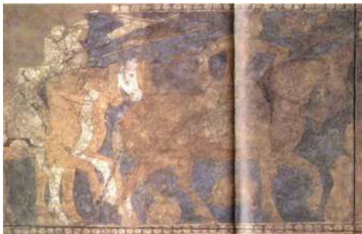
Парчами Рустами Достон

Дар илми муосир таърихнигорон ва бостоншиносон доир ба пайдоиши мафхуми Ковиёнӣ ақидаҳои мухталиф доранд. Аз ҷумла Баҳриддин Ализода дар таҳқиқоти худ овардааст 3 : «Баъзе муҳаққиқон бар он ақидаанд, ки вожаи Ковиён ба маънои дирафши Кова (Коваи оҳангар) ва дигарон ба маънои Каёнӣ (сулолаи Ковиён – Каёнӣён) маънидод кардаанд, ки маънои Кай, Каён-Ковиён баҳодур, қаҳрамон ва дар забони суғдӣ вожаи кави ба маъноҳои ҳоким, роҳбар ва шоҳ (дар тангаҳои Бухоро) омадааст. Дирафши Ковиёнӣ ба гуфтаи Фирдавсӣ, ки дар Шохнома қайд гардидааст, ҳангоми шӯриши мардум бо сардории оҳангар Кова бар зидди Заҳҳок ба вучуд омадааст. Кова шӯришчиёнро ба назди Фаридун, ки вориси қонунии сулолаи шоҳони Пешдодиён буд, овард ва ӯ ин дирафшро бо 4 ситораи тиллоӣ, сангҳои қиматбаҳо, матои ранги сурх, зард ва бунафшадор зебу ороиш дод ва «Дирафши Ковиёнӣ» ном гузошт. Дар адабиёти динӣ истилоҳи Кавӣ, Ковиён ба маънои баҳодур, қаҳрамон, таҳамтан омадааст.