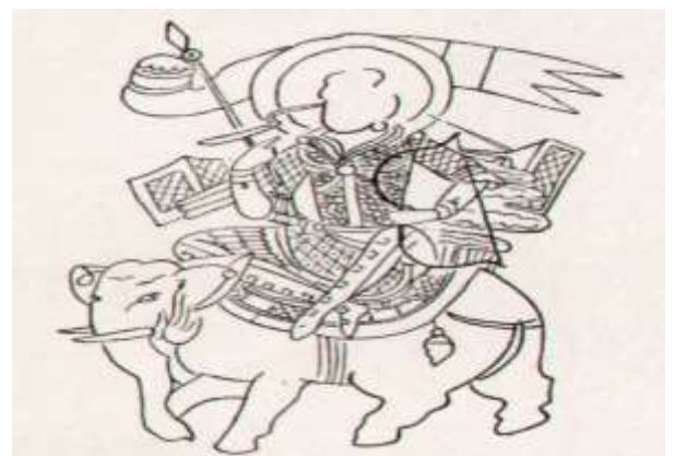
Парчами Бохтариён. Деворнигора. Қумтеппа