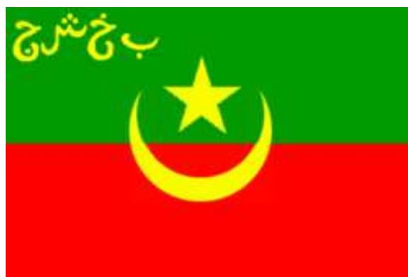
Парчами Республикаи Халкии Шӯравии Бухоро, 1921-1923