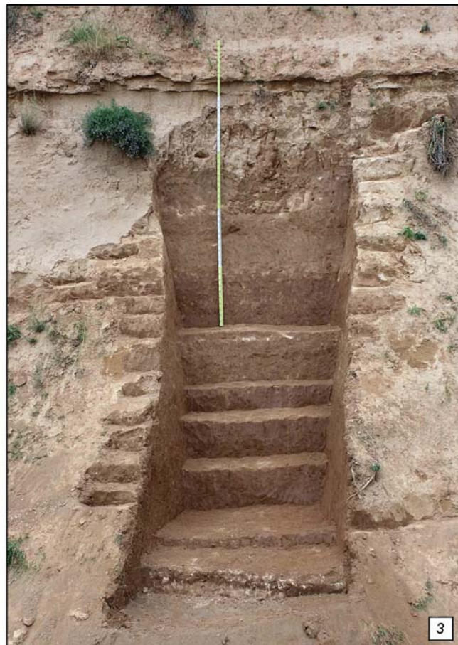
Рис. 2. Долина р. Оби-Мазар около памятника Лахути IV (1), острие из раскопа 3 (рисунок А.В. Абдульмановой) (2) и вид на раскоп 3 (2022 г.) после окончания работ (3).

Fe-Mn пленки на мелких биолитах (5 мм), \text{CaCO}_3 по мелким и крупным вертикальным порам, более окарбоначенный. Мощность – 45–50 см.