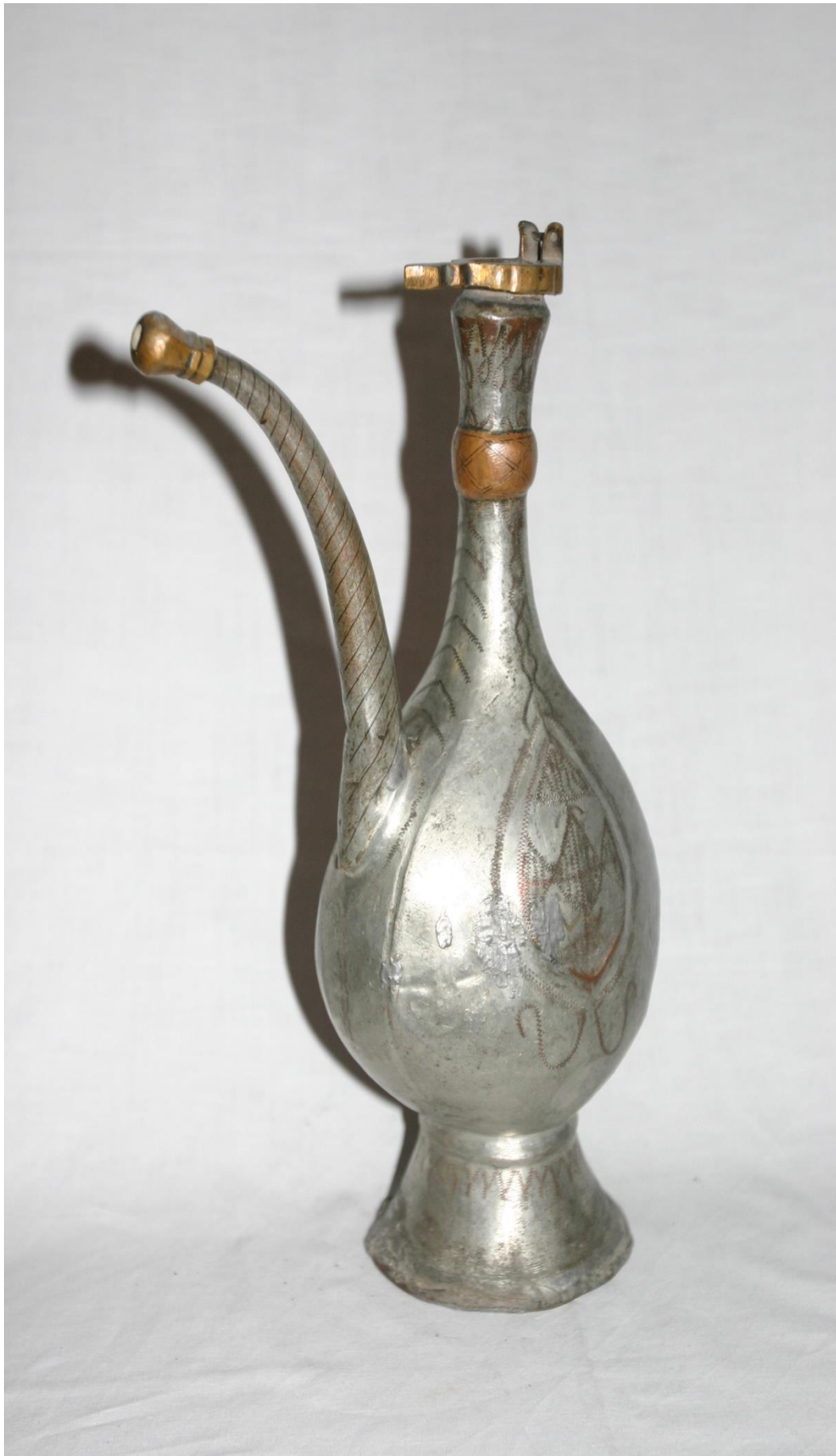
17. Кувшин куза. Зарафшан, XXв.