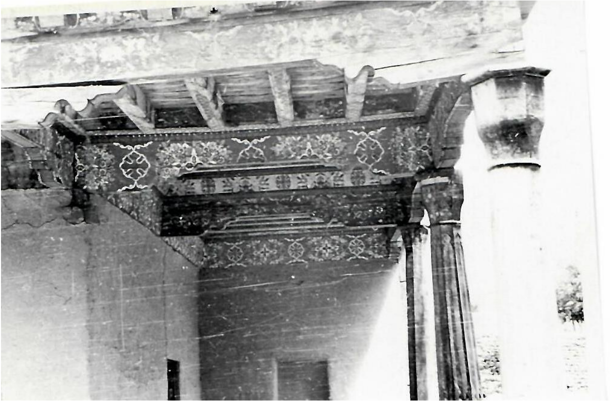
7. Мечеть Масджиди гулдор. деха Палдорак, 1957г.