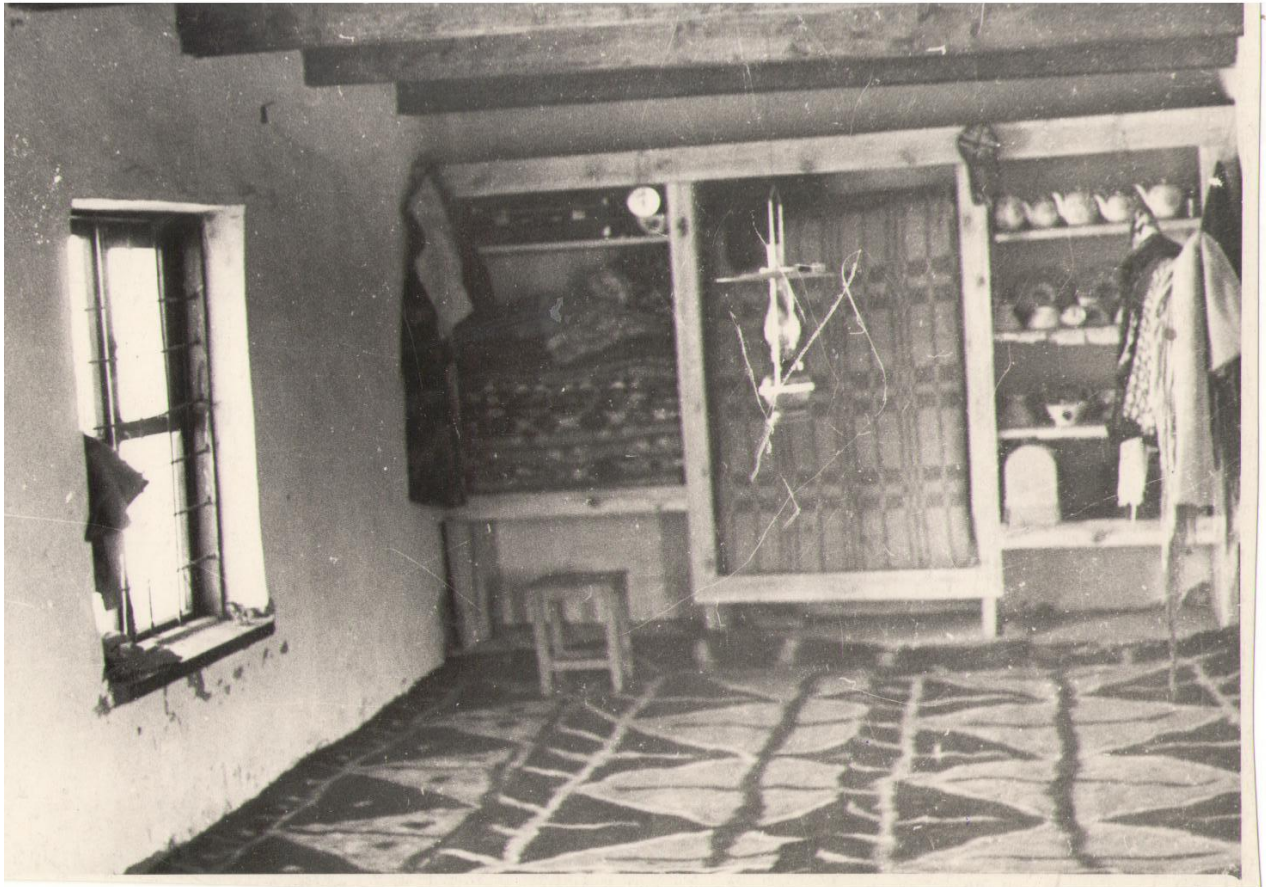
9. Убранство жилого дома колхозника Новоматчинский р-н. июль 1969 г.