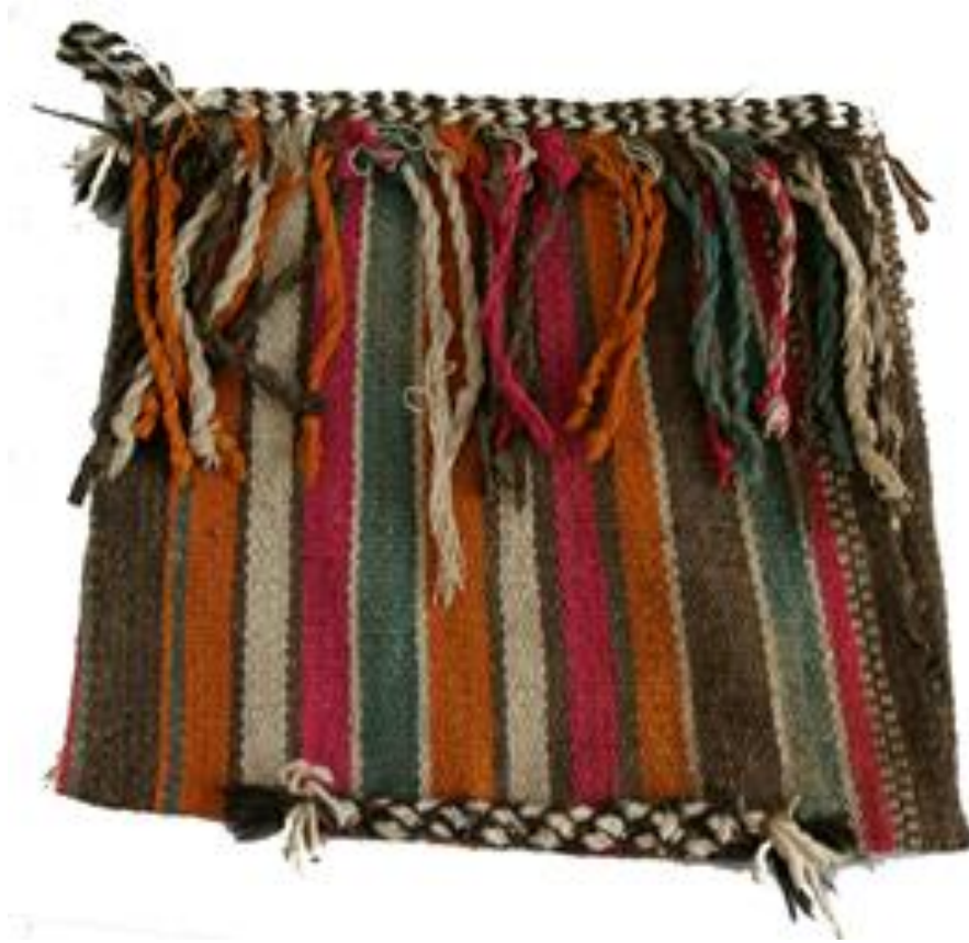
19. Переметная сумка хурчин. зарафшан, XXв.