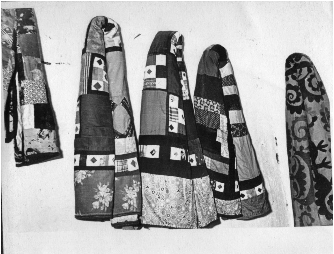
11. Образцы гулбурй . Пендижкент, 1965г.