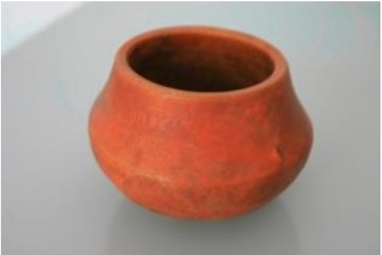
23. Деревянная чаша косачаи чубин Зарафшан, XXв.