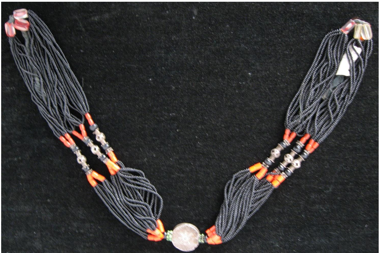
26. Бисерные бусы с сердоликом. Зарафшан, XXв.