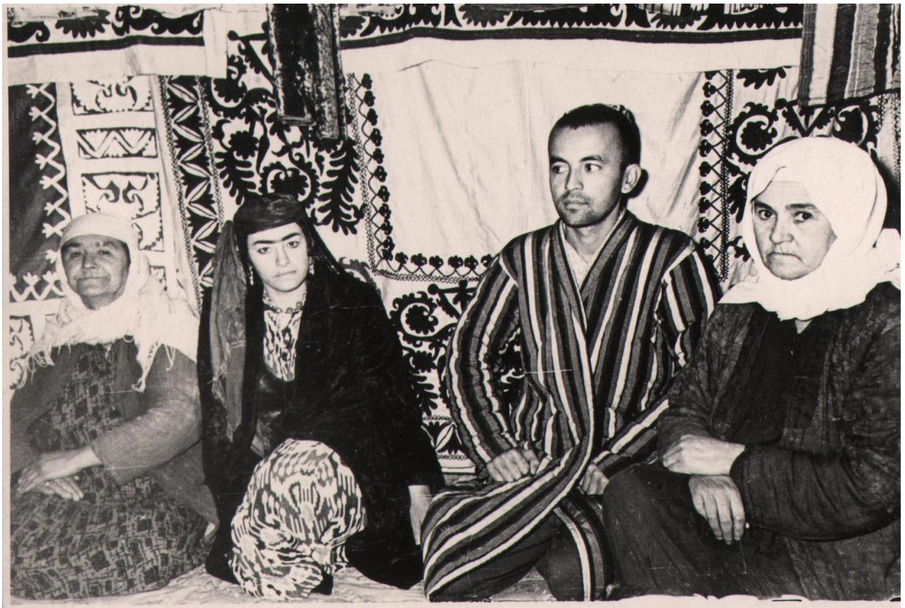
6. Жених и невеста. Пенджикент, 1985г.