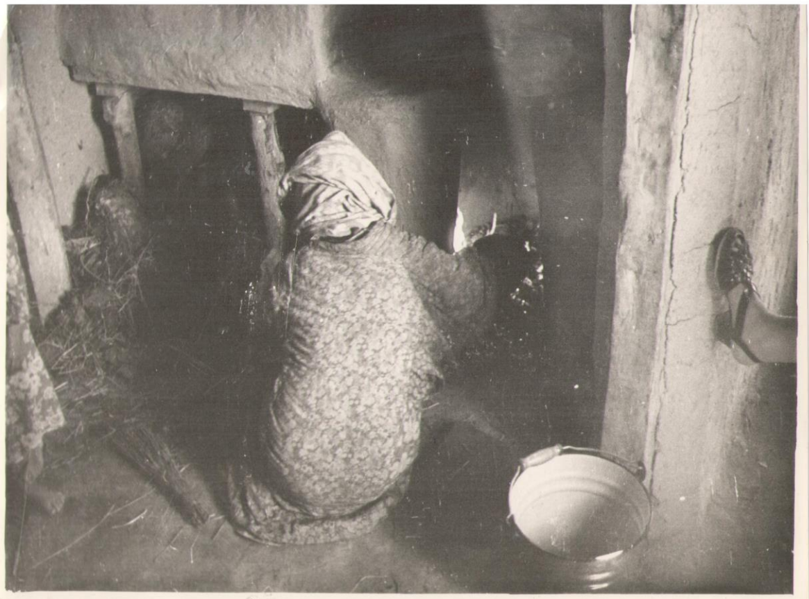
10. Способ выпечки хлеба в Новоматчинском р-не. Июнь 1961 г.