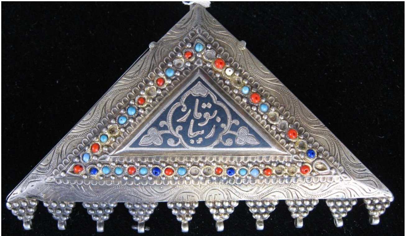
25. Амулет тумор . Зарафшан, начало XXв.