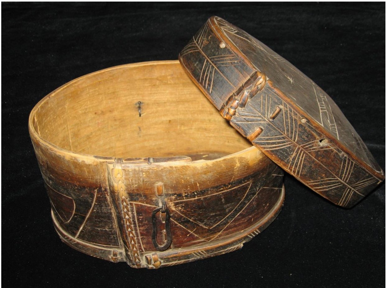
24. Сундучок для хранения чая. Ягноб, XXв.