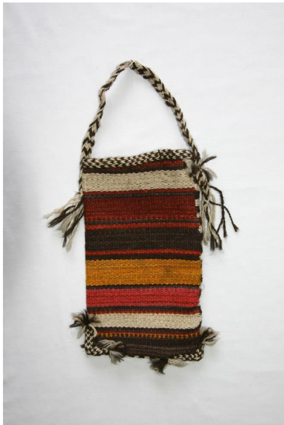
20. Мешочек для хранения соли намакдон. Зарафшан, XXв.