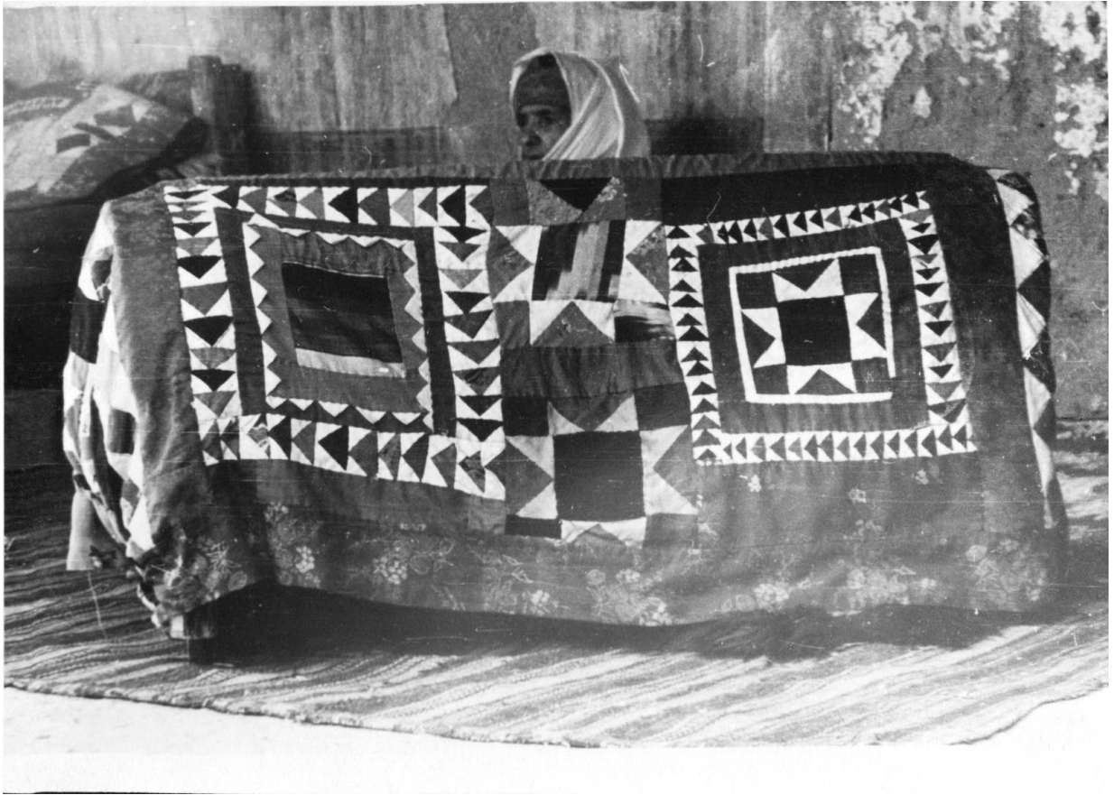
13. Покрывало на колыбель гахворануш . Деха Шаштут, 1965г.