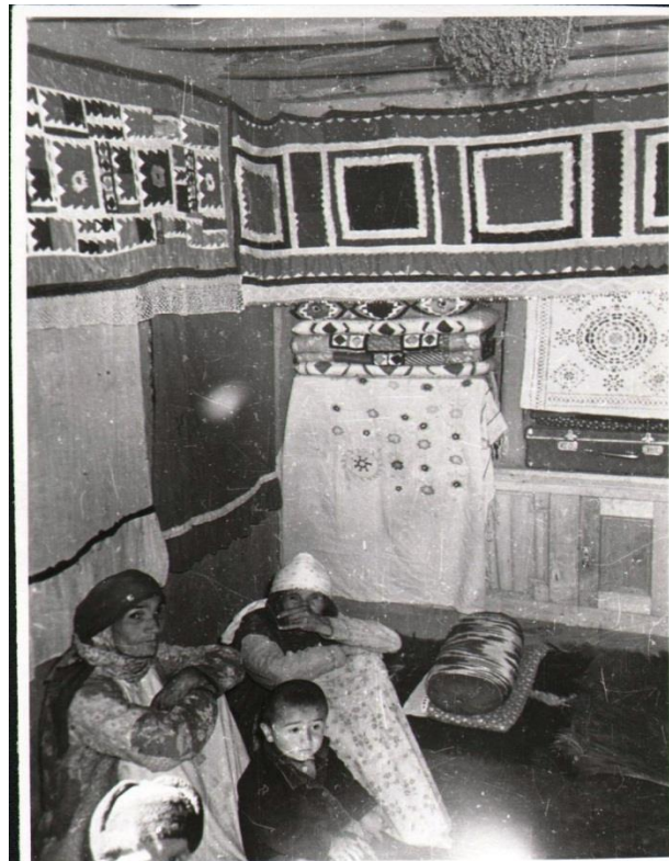
12. Деха Мадм. Комната, украшенная вышивкой и образцами лоскутного шитья гулбурй . 1965г.