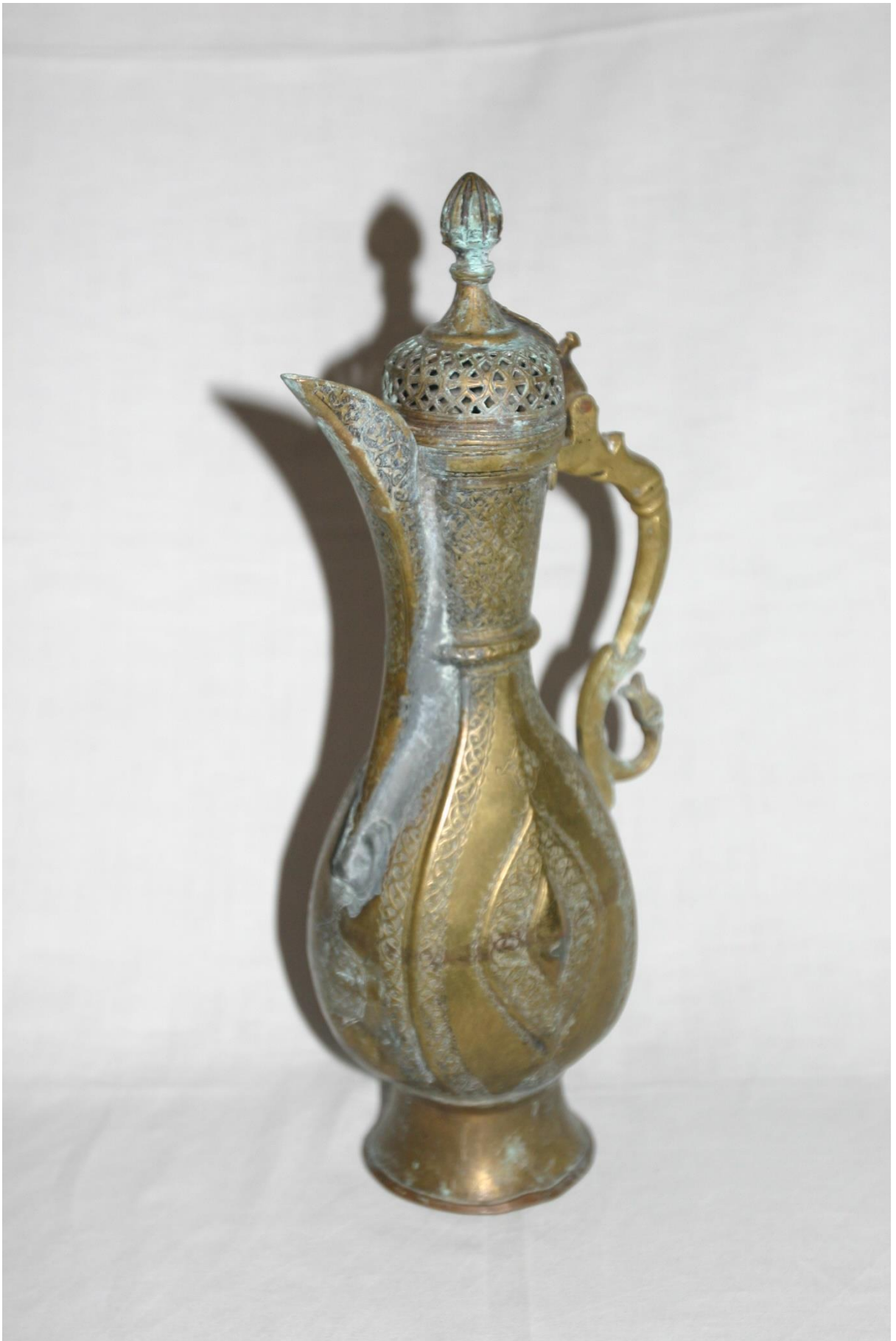
18.Кувшин офтоба в виде миндаля.Зарафшан,конецXIX-началоXXвв.