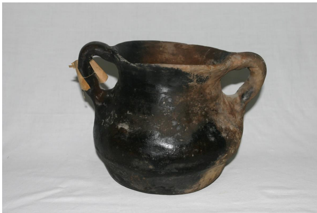
22. Керамический сосуд калла. Ягноб, XXв.